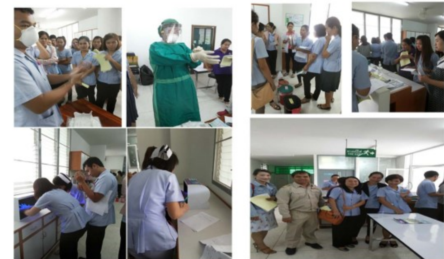
การพัฒนากระบวนการ IC โรงพยาบาลส่งเสริมสุขภาพตำบลเครือข่ายอำเภอพยุหะภูมิพิสัย การอบรมให้ความรู้แก่ผู้รับผิดชอบงาน IC ของ รพ.สต.