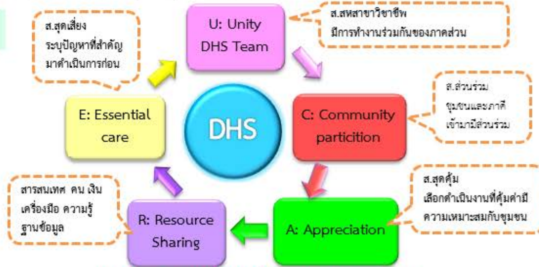
แผนภาพ กลยุทธ์ 5 ส.กับระบบสุขภาพอำเภอ

การขับเคลื่อนการป้องกันการบาดเจ็บจากอุบัติเหตุทางถนนด้วยกลยุทธ์ 5ส. ผ่านระบบสุขภาพอำเภอ (DHS) กระทรวงสาธารณสุข ได้กำหนดการดำเนินงานระบบสุขภาพอำเภอเป็นตัวชี้วัดหนึ่งในระดับจังหวัด "ร้อยละของอำเภอที่มี District Health System (DHS) ที่เชื่อมโยงระบบบริการปฐมภูมิกับชุมชนและท้องถิ่นอย่างมีคุณภาพ" ซึ่งคล้องกับนโยบายของกระทรวงสาธารณสุขที่พยายามผลักดันการทำงานและการป้องกันการบาดเจ็บจากอุบัติเหตุทางถนนผ่านระบบสุขภาพอำเภอ (DHS) ร่วมกับศูนย์ปฏิบัติการความปลอดภัยทางถนนและอำเภอ (สปถ.อำเภอ) และทีมสหสาขาวิชาชีพ เน้นการมีส่วนร่วมของทุกภาคส่วนที่การทำงานร่วมกัน (Team) ร่วมรับรู้ ร่วมคิด ร่วมดำเนินการ ร่วมประเมินผล โดยมีเป้าหมายร่วมกัน